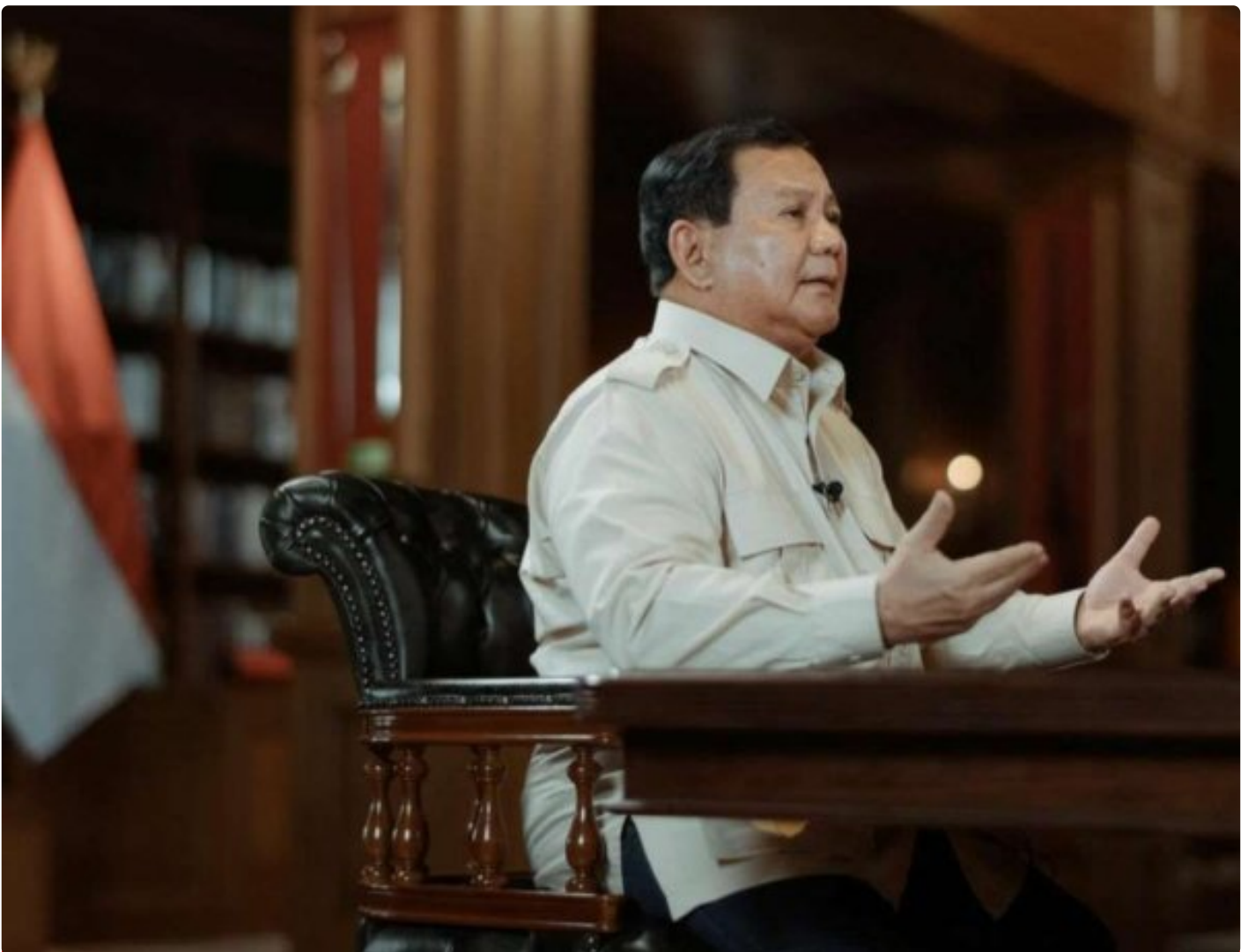
Prabowo Subianto Presiden RI 2024-2029

PENDIDIKAN - Indonesia dikenal sebagai negara yang kaya akan sumber daya alam. Dari hasil tambang yang berlimpah, laut yang luas dengan kekayaan hayati yang melimpah, hutan yang menjadi paru-paru dunia, hingga sumber daya energi